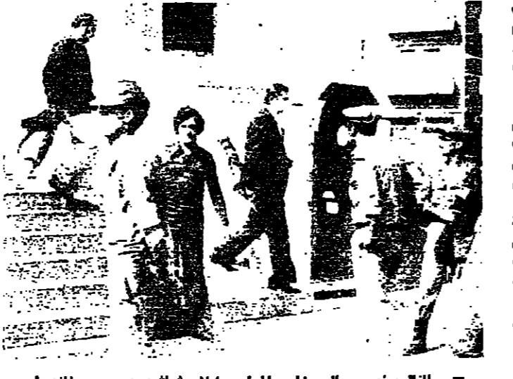
النائب نعيم سالم يغادر المجلس حاملاً رشايشه، ويبدو خلفه احد المرشحين المسلمين

التواب الذين نزلوا الى المجلس أمس، معظمهم كان مسلحاً، بعضهم كان يحمل رشاشاً والبعض الآخر كان يحمل مسكناً... ومن لم يكن يحمل سلاحاً كان يصطحب مرافقين مسلحين... كل ذلك كان من قبيل التصيب بعد حادثة وصول بعض المسلمين الى ساحة البرلمان أثناء تواجد النواب فيه يوم الثلاثاء الماضي... الا ان رئيس المجلس منع دخول المرشحين المسلمين الى هرم المجلس... ولم يتقبل التصيب ضد الجلسة التي كانت مقررة أمس، وتكرار الفشار الذي شنعه الاتقياء على وقف اطلاق النار والمساعي التي كانت متبولة أمس لتثبيت هذا الاتفاق، هي التي ادت الى تجميع جلسة المجلس التي اعيد في وقت لاحق، وقررت في ضوء الظروف المستجدة بعد الاتفاق الأخير.